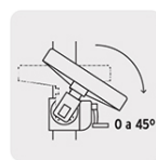
Mesa inclinable de 0 a 45°