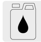
Aceite monogrado SAE30