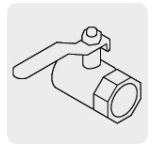
Salida para manguera de 3/4"